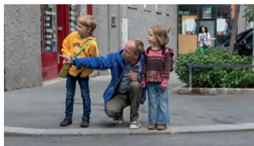
Regelmäßiges, gemeinsames Training ist wichtig!

Gehen Sie mit Ihrem Kind den Schulweg ab und erklären Sie ihm, warum es wo gefährlich ist und worauf es als Fußgängerin bzw. Fußgänger achten muss. Üben Sie problematische Stellen (siehe Schulwegplan) besonders gut! Beim nächsten Mal lassen Sie sich bereits von Ihrem Kind führen, das dabei über sein Verhalten spricht. So können Sie feststellen, ob es alles richtig verstanden hat und eventuell korrigierend eingreifen.