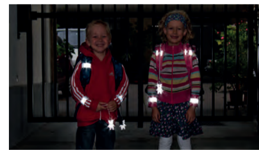
Sicherheit durch Sichtbarkeit!

Sorgen Sie dafür, dass Ihr Kind im Straßenverkehr rechtzeitig gesehen wird! Gerade im Herbst und Winter, wenn es in der Früh noch dunkel ist oder bei nebligem Wetter ist helle Kleidung von Vorteil. Noch besser wirken Reflektoren an Kleidung und Schultaschen – mit diesen können Kinder von Fahrzeuglenkerinnen und Fahrzeuglenkern schon aus einer Entfernung von 130 Metern wahrgenommen werden.